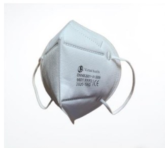
Mascherina FFP2 priva di valvola